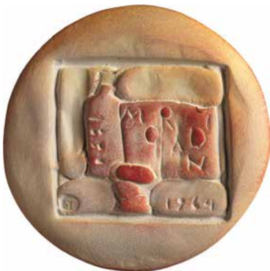
Geer Steyn, Morandi-penning. 2021, terracotta, 75 x 75 mm