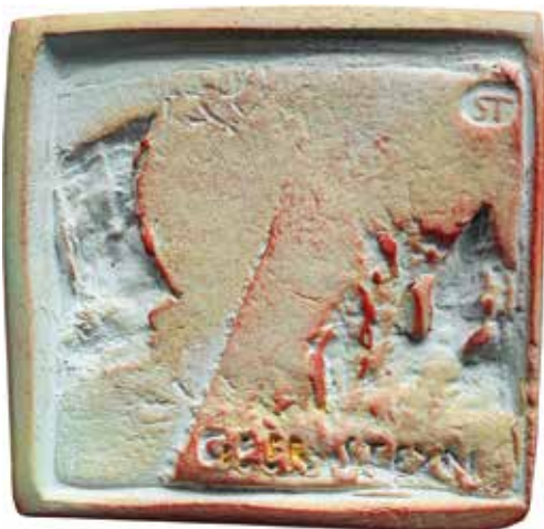
Geer Steyn, Hollands zelfportret . 2014, terracotta, 65 x 66 mm (foto's: kunstenaar)

keerzijde een rotsstructuur met een vliegende vleermuis en zijn naam GEER STEYN. 9 De penning staat ook in de monografie. Wat een man, die zoveel heeft betekend voor de penningkunst, ook als docent aan de Koninklijke Academie voor Beeldende Kunsten in Den Haag. Heel bijzonder om bij hem te gast te zijn geweest.