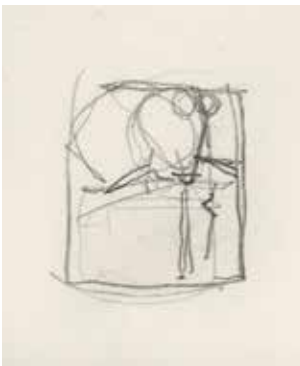
Geer Steyn, Schetsen voor de Morandi-penning