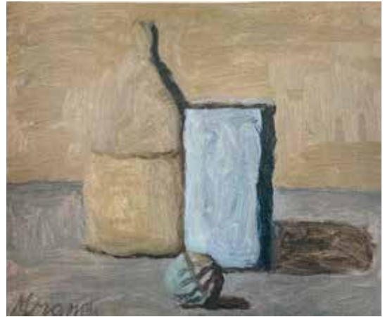
Giorgio Morandi, Natura Morta . 1964, olieverf op doek, 25,5 x 30,5 cm (particuliere collectie, afbeelding uit Pasquali e.a.). 6